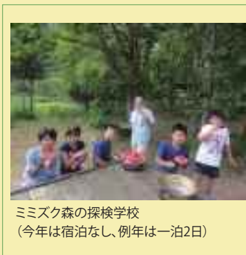
ミミズ森の探検学校 (今年は宿泊なし、例年は一泊2日)

ここ数年、1000本のキャンドルライトの中止など、新型コロナウイルスの影響を受けていました。今年は、3月19日のかんじきツアー、4月29日のオープンからはじまり、春の連休中のキッズ・アート、嵐山屋敷、5月のアズマヒキガエル駆除作戦、ミミズ森の探検学校(8月1日、2日予定)、嵐山縦走ハイキング(6月と10月)、森の交流会(8月15日)、1000本のキャンドルライト(12月)に子供さんの木育講座も予定しています。 ★友の会「トレイル」入会者募集中、 一般会員2000円、家族会員3000円、いずれも年会費。