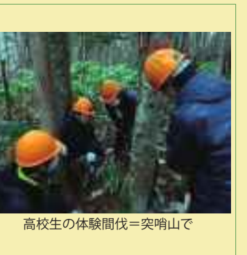
高校生の体験伐採＝突哨山で

【e-mail】 ask@morinet-h.org 【会の公式サイト】 www.morinet-h.org