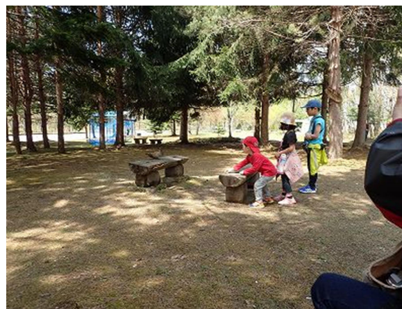
一から始めるバードウォッチング 神楽岡公園 (2018/05/14)