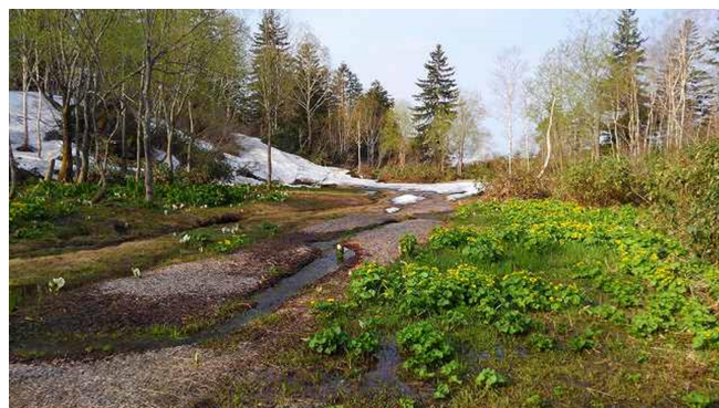
第5回早朝識別勉強会 旭岳温泉 (2018/05/28)