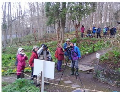
第2回早朝識別勉強会 嵐山 (2018/05/05)