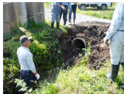
開水路の補修作業