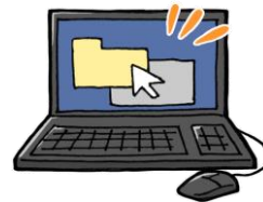
ホームページからダウンロードする ★ホームページの記載内容をご確認ください