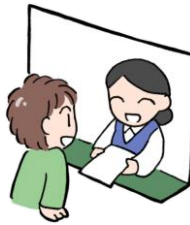
直接来館する 窓口へお越しください