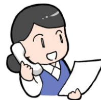
内容確認のためお電話をいたします