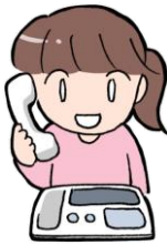
電話をする 当館からFAXをお送りします