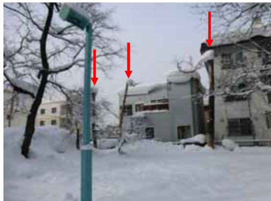
写真 1 - 1