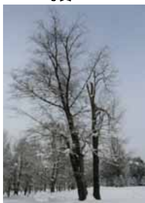
写真 2 - 1