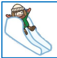
昨年好評だったかまくらが今年も登場! 子ども達を楽しめるすべり台もあるよ!!