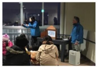
雪あかりの動物園が何倍も楽しくなる旭山オリジナルの紙芝居!