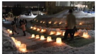
園内を彩るアイスクヤンドル!