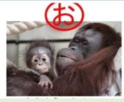
園内に掲示している動物看板を探して、ポストカードをGETしよう!