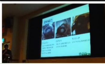
初の試み! 飼育スタッフがプロジェクターを使って、中身の濃い動物解説を行います! (飲みものを飲みながらどうぞ)