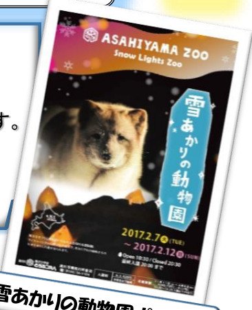
雪あかりの動物園ポスター