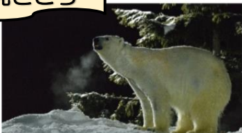
冬夜に元気な動物達!