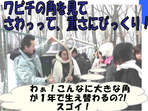
わぁ！こんなに大きな角が1年で生え替わるの?! スゴイ！

また、不定期で行っているワピチのもぐもぐタイムでは、エサを食べる姿が見られるだけでなく、トナカイやワピチ・エゾシカの角を見比べて、実際に触ってみることが出来ます。ここでは、闘争に角を使うシカの社会において、強いオスのみが子孫を残すことができるなど、野生の厳しさを感じられるガイドになっています。 休園（4/9、4/27）前にもう一度、動物たちに会って見ませんか？