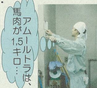
アムールトラは、馬肉が15キロ...

ライオン・カバ・サル... など、飼育係員に担当動物があるように、「エサ」にも担当者がいます。旭山動物園で飼育している約140種・700点もの動物たちはいろいろな物を食べます。小鳥たちが食べるミルワーム(幼虫)や果物、草食動物たちの乾牧草、猛獣たちが食べる馬肉や豚骨、アザラシの主食のホッケなどさまざまです。それらが集まる調理棟では、毎日エサの準備が行われています。翌日のエサに合うように冷凍保存していたものを必要な分だけ解凍したり、動物ごとにエサを取り分けたりしています。翌朝、それぞれの動物担当者がエサを計り、野菜を切ったり、混ぜ合わせたり下準備をします。飼育