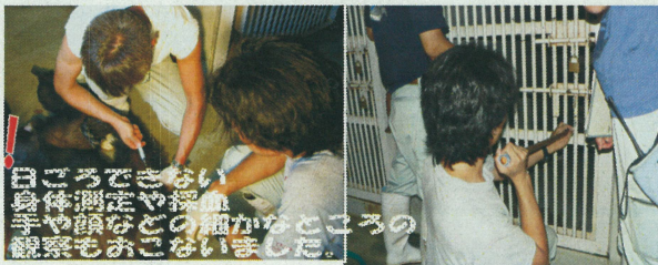
チンパンジーの好きな ジュースに薬を入れ混ぜます