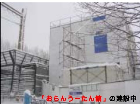
「おらんうーたん館」の建設中

建設中のトイレ 現在、冬期向けに来園者のためのトイレと、「オランウータン」の展示施設を急いで建設しているところです。 トイレは12月25日から使用できます。「おらんうーたん館」のオープンは1月中旬の予定です。 ぜひ、お楽しみください！