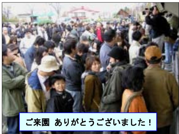
ご来園 ありがとうございます！

十月十九日到着したルルですが、イワンに歓迎され、意外に早く新しい環境になれて仲良くじやれあつています。 ルル イワン