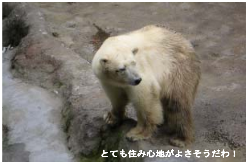
とても住み心地がよさそうだわ！

祖父母を訪ねて父のふるさと旭山動物園へ！ 大分県別府市の動物園で生まれたホッキョクグマのルル！ ルルは、旭山動物園(日本)で初めて繁殖に成功した(で)で生まれたダイ(シロウとユキの仔)の仔です。ルルの父親(ダイ)は、ハッピーのお兄さんなのです。ですから、ルルはハッピーの姪にあたります。 「ほっきょくぐま館」には、ルルの「おじいちゃんやおばあちゃん」も展示されています。きつと、お会いしたことがある方もいると思います。 大分県別府市にある動物園で生まれたルルは、東北の動物園で飼われていましたが、この度、旭山動物園にくることになったのです。 道中は、せまい檻に入り、トラックに載せられ、二日がかりの長旅となりました。きつと疲れがいつぱいたまったことでしょうね。 最近、国内(飼育下)でのホッキョクグマの繁殖成功例が少な