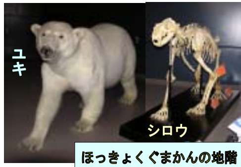
ほっきょくぐまかんの地階

一方、イワンと同居していたハッピーは、カンゾウがいた、ドーム型カプセルのある運動場でココキと仲良く過ごしています。 ココキ ハッピー