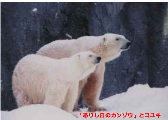
「ありし日のカンゾウ」とココキ