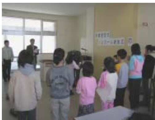
2004年3月の表彰式の様子