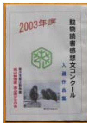
読書週間に併せて、旭川市内の小学生を対象に

読書週間に併せて、旭川市内の小学生を対象に始めましたが、市外の方からの応募希望もあり、前回から、市外の方から郵送されてきた作品も併せて審査対象に入れることになりました。 応募要項・応募は、旭川市内の公民館・図書館にあります。