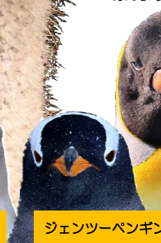
ジェンツーペンギン