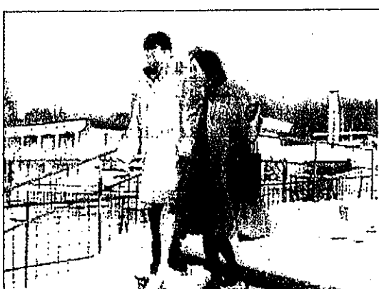
11月28日、雪がたくさん降った日曜日