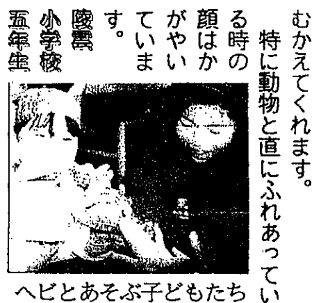
むかえてくれます。特に動物と直にふれあっている時の顔はかやいていませう。小学校教育 五年生