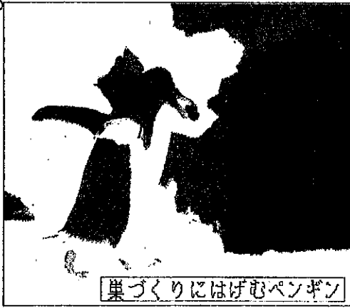
巣づくりに忙しむペンギン