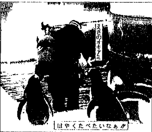
はやくたべたいなあ

雪像はありませんが、生き生きとした動物たちの生の像をたくさん見ることが出来ます。真っ白な雪の中で見る生きた