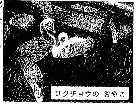
コクチヨウのおやこ