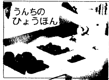
うんちのひょうほん