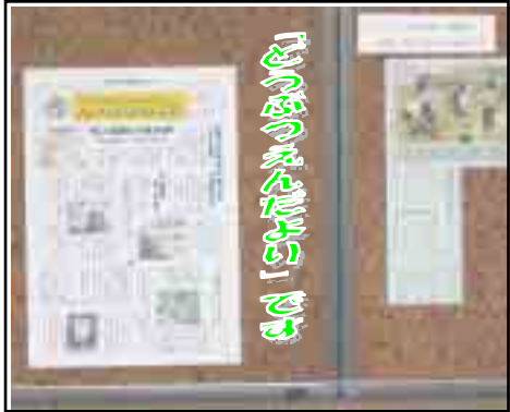
中央図書館の掲示板