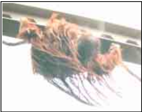
とても怖そうに渡るジャック