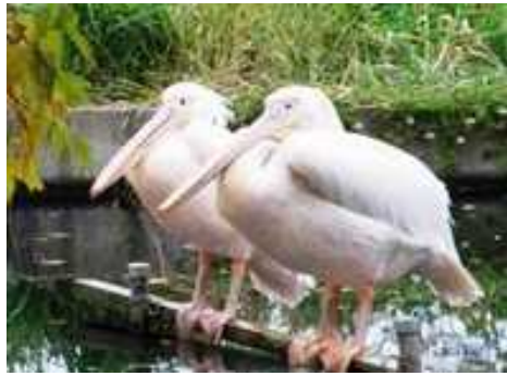
モイロペリカン：寒さが苦手なので、冬期開園中は暖かい越冬施設にて過ごします。来年の春に会いましょう！

この時期は、夏毛から冬毛への生え替わりが見られます。ホツキョクギツネは冬の寒さに耐えられるようにふわふわの毛が生えてきました。(写真は10月の様子)エゾユキウサギの毛が茶色から白に変わったり、エゾシカの体は、白い斑点がなくなり、厚みが増すといった、色々な変化が見られます。皆さんにお会いできる冬の開園にはどんな姿