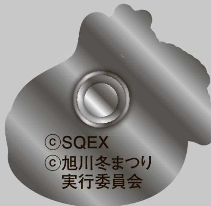
バッジ裏面(留め具/タイタック)