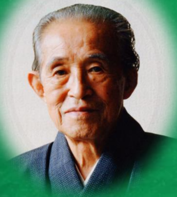
井上 靖 (1907年~1991年)

北海道旭川市生まれ。京都帝国大学卒業後、大阪毎日新聞社に入社。1950(昭和25)年『闘牛』で芥川賞受賞。代表作に『しろばんば』・『風林火山』・『氷壁』・『天平の甍』・『敦煌』・『孔子』等。