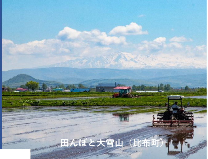
田んぼと大雪山（比布町）