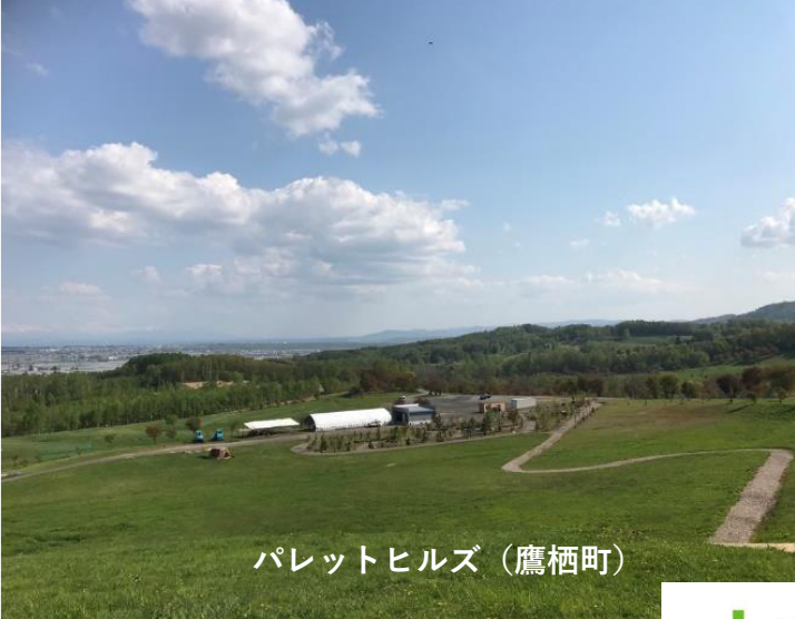
パレットヒルズ（鷹栖町）