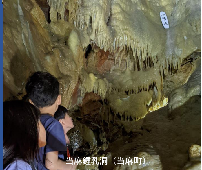
当麻鍾乳洞（当麻町）