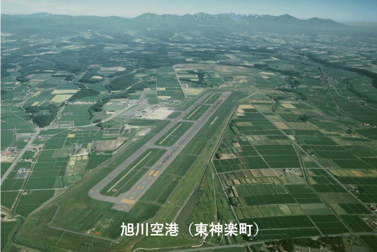
旭川空港（東神楽町）