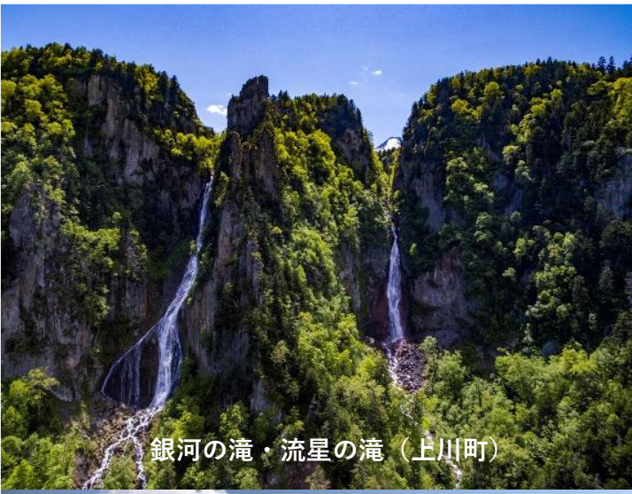
銀河の滝・流星の滝（上川町）