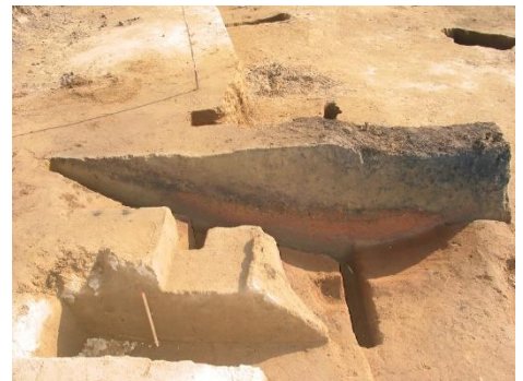
川端2遺跡 3号住居跡カマドの断面