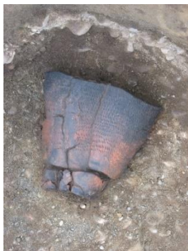
緑町1遺跡出土の土器