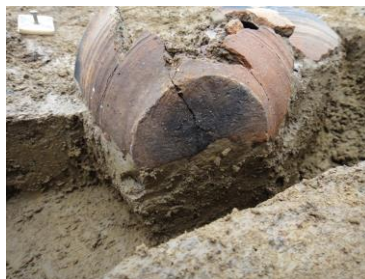
近文町5遺跡出土の土師器