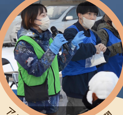
アンケートの結果を公開

「スノーコミュニケーション」は雪国旭川で冬や雪をより楽しくとらえ、健康で豊かな生活を目指す取り組みをしています！！