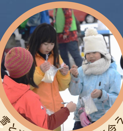
楽しく・健康に付き合おう