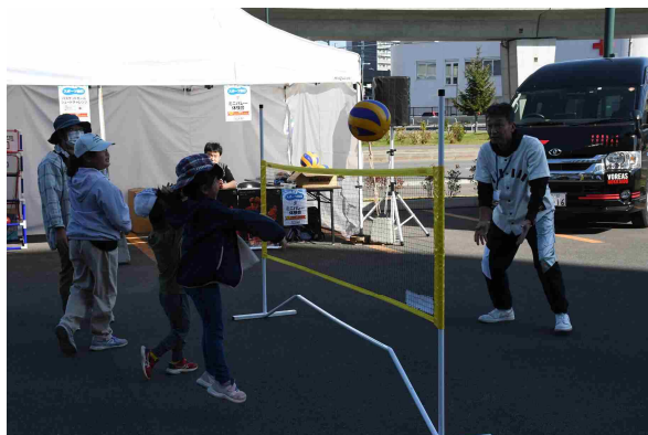
スポーツ縁日（ミニバレー）