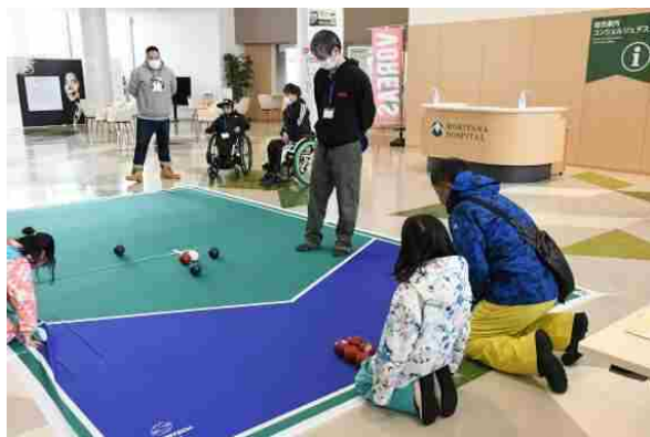
ニュースポーツ体験（ボッチャ）