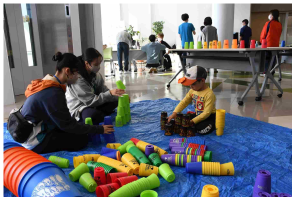
ニュースポーツ体験（スポーツスタッキング）