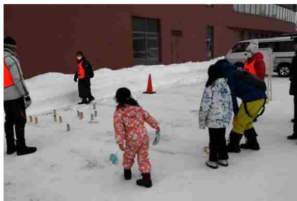
ニュースポーツ体験（モルック）