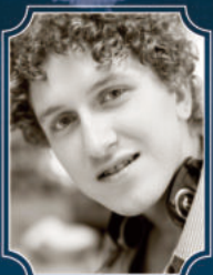
コスチャンチン・マイオロフ