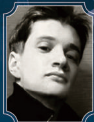
タラス・コブシユン