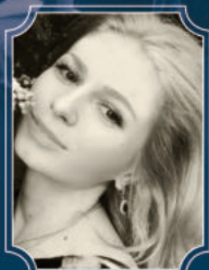
オクサーナ・ボンダレンコ