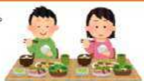
旭川市民の野菜摂取量 (令和3年度旭川市栄養調査)