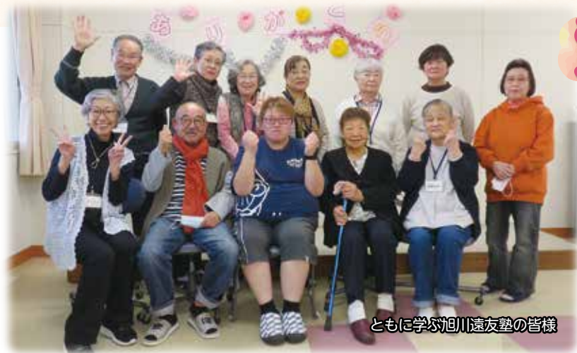
ともに学ぶ旭川遠友塾の皆様

共同募金運動は町内会や地区社会福祉協議会のご協力で成り立っています。今年も地区共同募金委員会から募金資材をお届けいたしますのでご協力をお願いいたします。