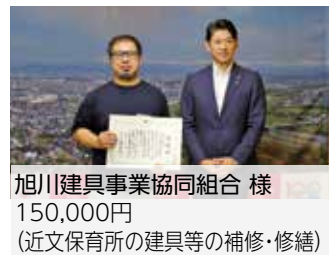
旭川建具事業協同組合 様 150,000円 (近文保育所の建具等の補修・修繕)