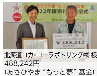
北海道コカ・コーラボトリング(株) 様 488,242円 (あさひやま“もっと夢”基金)