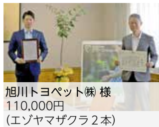
旭川トヨペット(株) 様 110,000円 (エゾヤマザクラ2本)