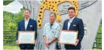
北海電気工事(株) 様(右) 石森電気工事(株) 様(左) 200,000円(旭山動物園の照明器具清掃)