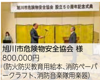
旭川市危険物安全協会 様 800,000円 (防火防災教育用絵本、消防ペーパークラフト、消防音楽隊用楽器)