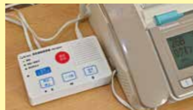
迷惑電話防止機能付き電話