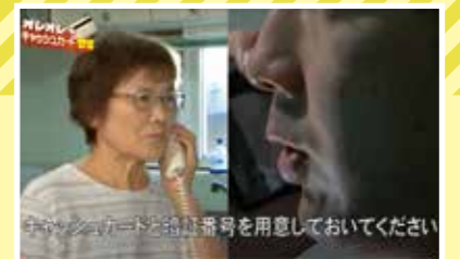
旭川市YouTubeで特殊詐欺被害防止動画「ちょっと待った。それはサギ(詐欺)です」を配信中

多くの高齢者の目に触れる金融機関や病院などで啓発動画を流し、特殊詐欺の被害を減らしたい。市からその思いを聞き、制作費を寄附する形で撮影・編集しました。オレオレ+キャッシュカード詐欺、架空料金請求詐欺、還付金詐欺と、実際に市内で発生した3つの例を再現。だまされる流れや手口の巧妙さが直感的に分かるよう、生活感のある室内やATMなど演出や場所も工夫しました。インパクトを考慮し、今津市長には「ちょっと待った!」と呼び掛けてもらいました。映像は地域の会合など、幅広い場面でフル活用してほしいです。