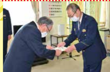
特殊詐欺被害根絶モデル地区指定式

若草町内会は北海道警察から特殊詐欺被害根絶モデル地区に指定され、詐欺電話を受けないための「迷惑電話防止機能付き電話」の普及に向けて活動しています。町内会行事で警察の方から実態を聞き、手口の巧みに驚きました。相手のペースに乗せられると危険で、この機能が付いた電話が役立ちそうだと分かりました。昨年12月に自宅に設置しましたが、物品の購入を呼び掛ける迷惑電話がなくなりました。町内の回覧板や広報を通じて、この機能の効果や、詐欺被害が人ごとではないことを繰り返し伝えていきたいです。