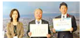
明治安田生命保険相互会社旭川支社 様 256,000円 (長寿社会生きがい基金)