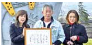
株ヴァンドームヤマダ 様 693,476円 (あさひやま“もっと夢”基金)