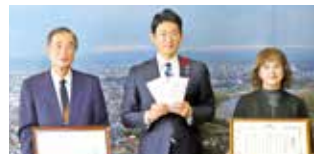
株太田硝子店 様 800,000円 (スポーツ振興基金等)