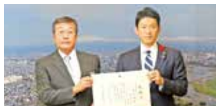
北海電気工事(株)旭川支店 様 128,400円 (福祉施設の窓・網戸清掃)