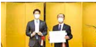
(一社)旭川建築協会 様 500,000円 (庁舎建設整備基金)