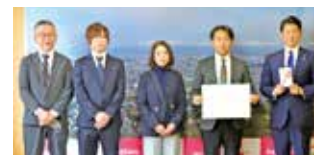
株ベルシステム24 様 300,000円 (市制施行100年記念事業)