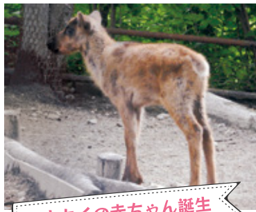
トナカイの赤ちゃん誕生

昨年、一昨年に続き今年もトナカイが出産。生まれた子は雌で、名前はピコロです(6/9撮影)