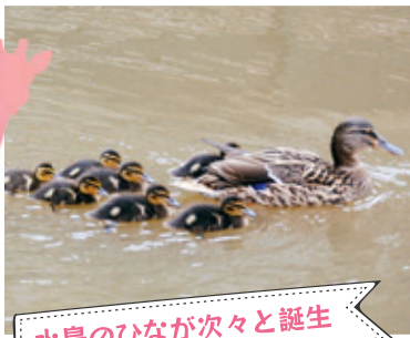
水鳥のひなが次々と誕生

4月に孵化したシマフクロウ2羽が無事巣立ちました。旭山動物園では初の自然繁殖です(6/9撮影)