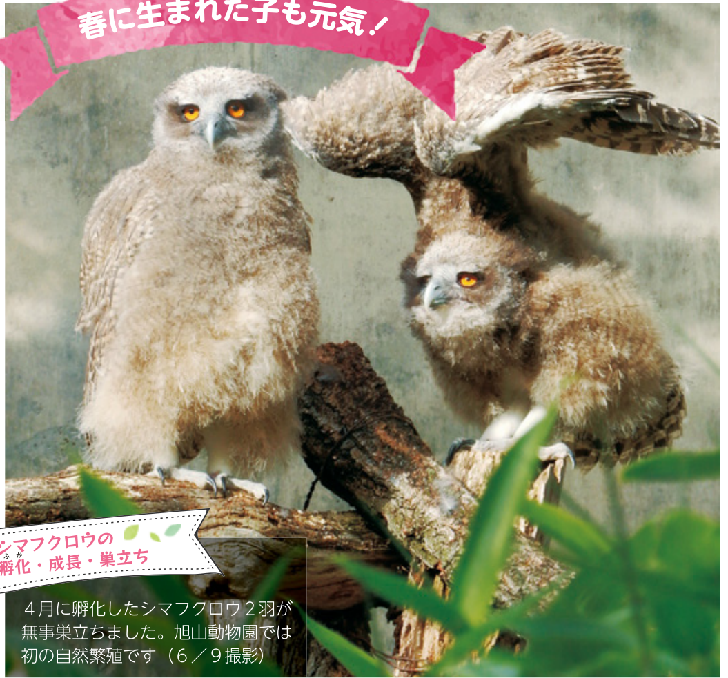
シマフクロウの 孵化・成長・巣立ち

4月に孵化したシマフクロウ2羽が無事巣立ちました。旭山動物園では初の自然繁殖です(6/9撮影)