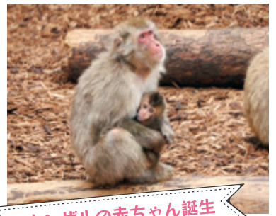
ニホンザルの赤ちゃん誕生

昨年、一昨年に続き今年もトナカイが出産。生まれた子は雌で、名前はピコロです(6/9撮影)