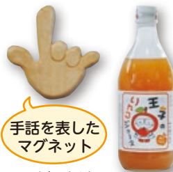
手話を表したマグネット