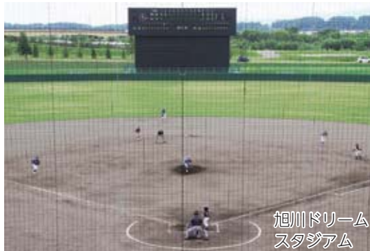
旭川ドリームスタジアム