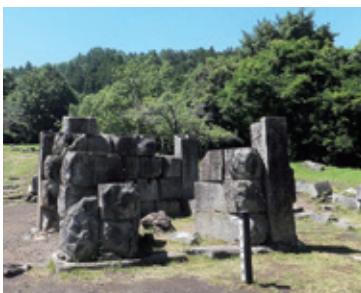
☉橋野鉄鉱山 三番高炉跡

また、ラグビーが盛んで「ラグビーワールドカップ2019」の開催地選ばれています。皆さんも釜石市に出掛けてみませんか。詳しい情報は釜石市広聴広報課(☎0193・22・2111)へ。