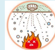
スプリンクラー設備