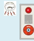
自動火災報知設備