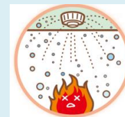
スプリンクラー設備