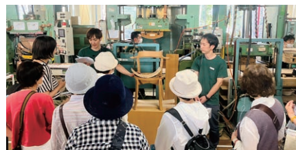
オープンファクトリー