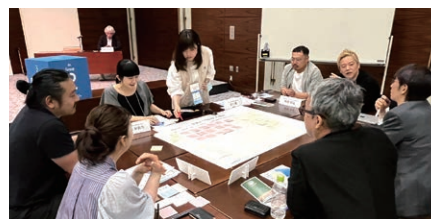
あさひかわデザイン会議