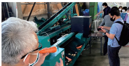
ものづくりツアー