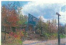
北彩都あさひかわ