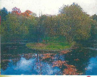
神楽岡公園の総面積は40.99haです。